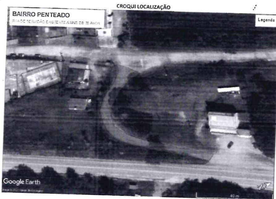
IMAGENS GOOGLE EART 15/10/2002

Rua Emilia Pires, 135 - Embu-Guaçu - SP - CEP 06900-000 Tel/Fax 4661-1078 - E-mail camaraembuguacu@camaraembuguacu.sp.gov.br